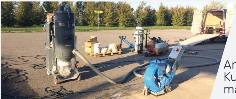
Anwendung mit Kugelstrahlmaschinen