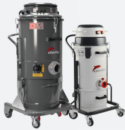
Anwendung mit Bodenfräsmaschinen