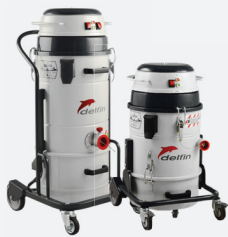
Anwendung mit Elektrowerkzeug