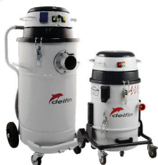
Anwendung mit Kernbohrmaschinen