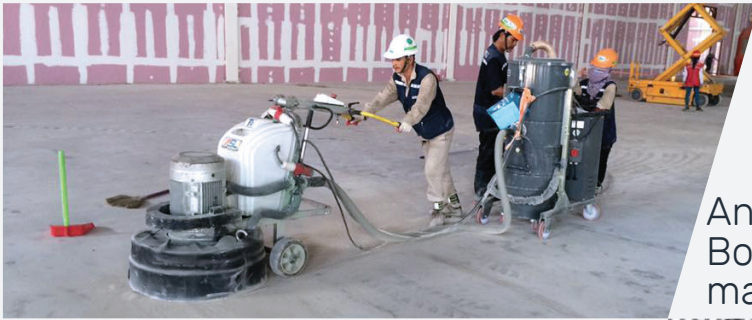
Anwendung mit Bodenschleifmaschinen