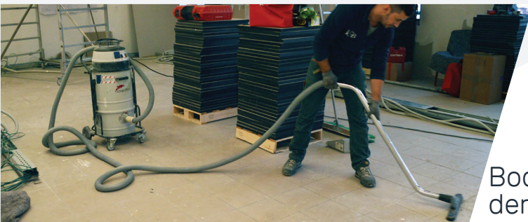
Bodenreinigung nach der Bodenbearbeitung